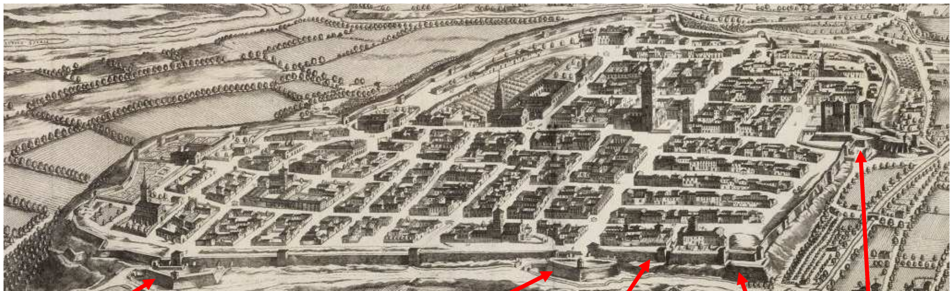
Bastione di Porta Sarmatoria